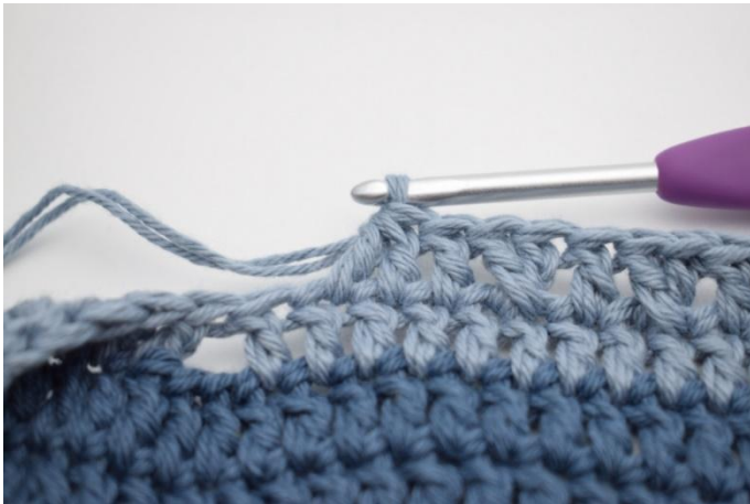
9. Crocheter 2 b ens.