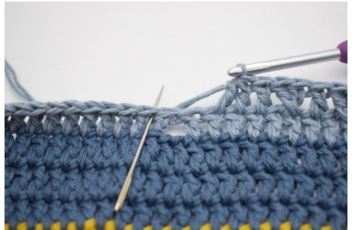
10. Sauter 2 m.