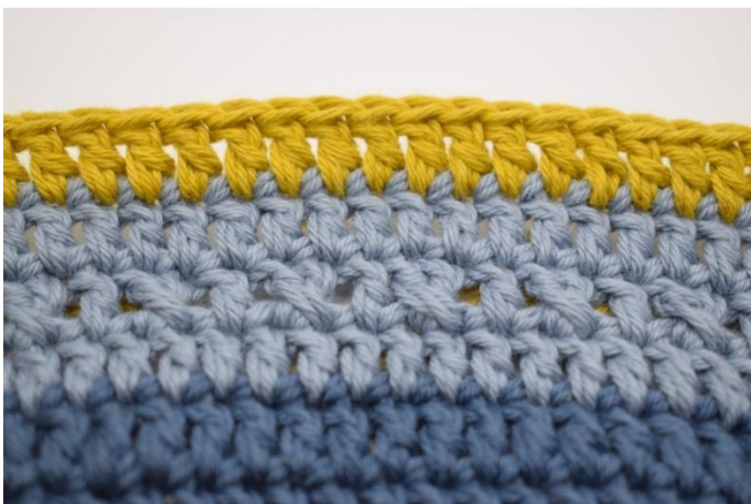
9. Il y a à présent 1 tour avec le motif et 2 tours avec des b.