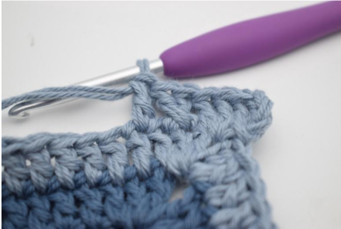
7. Crocheter 1 b dans la m suivante.