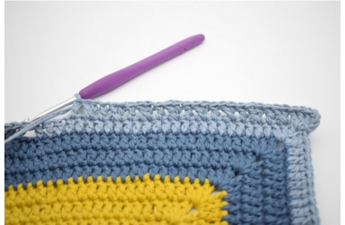
8. "Sauter 1 m et crocheter 1 b. Crocheter 1 b dans la m qui vient d'être sautée. Crocheter 1 b dans la m suivante". Répéter de "à" 8 fois.