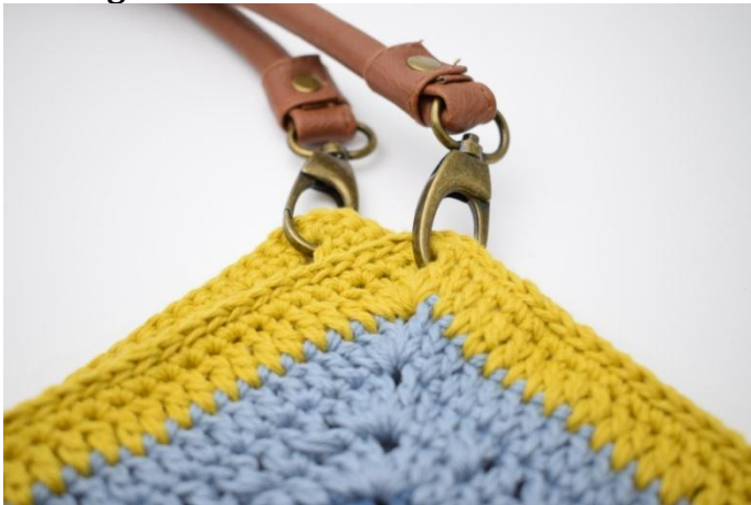
Accrocher les anses aux "pointes".