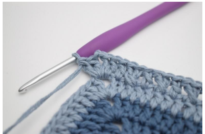
16. Crocheter 2 b, 2 ml et 2 b dans l'arceau suivant.