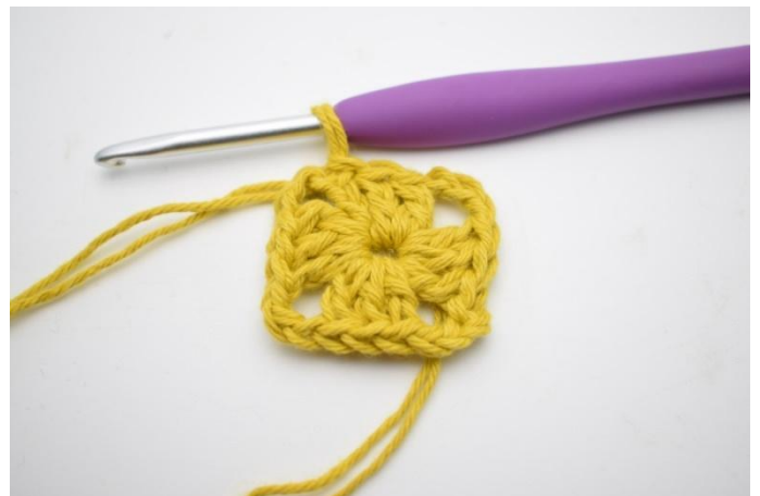
4. Crocheter 2 b. Finir avec 1 mc dans la 3ème ml du début du tour.