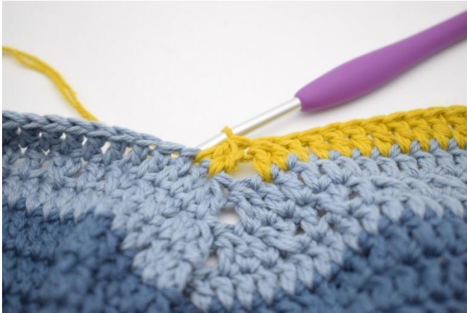
5. Comme ceci.