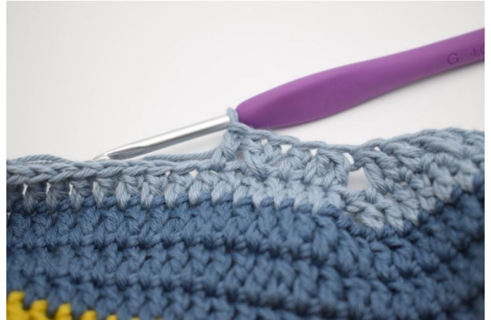
14. Crocheter 1 b dans la m suivante.