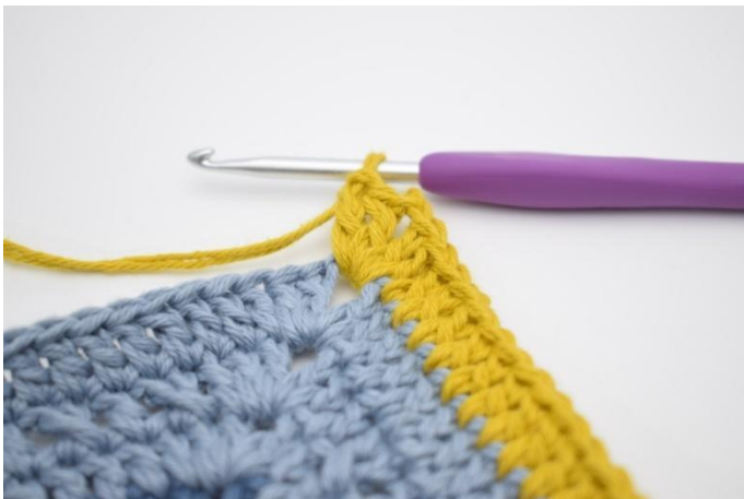
7. Crocheter 2 b, 2 ml et 2 b dans l'arceau suivant.