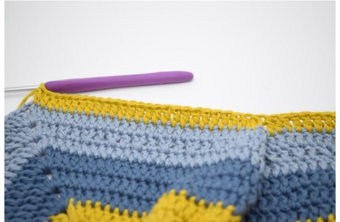
6. Crocheter 1 b dans les 25 m suivantes.