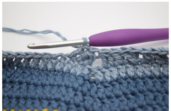
12. Crocheter 1 b dans la m suivante.