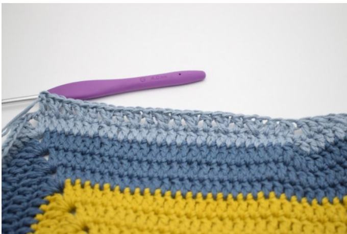
15. "Sauter 1 m et crocheter 1 b. Crocheter 1 b dans la m qui a été sautée. Crocheter 1 dans la m suivante". Répéter de "à" 8 fois.