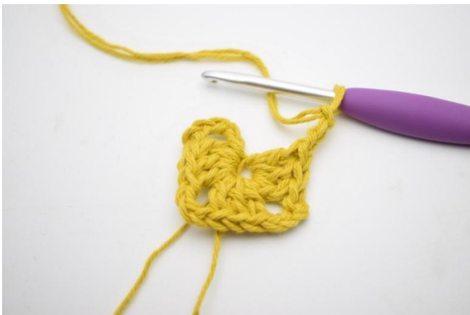
3. Répéter de "à" en tout 3 fois.