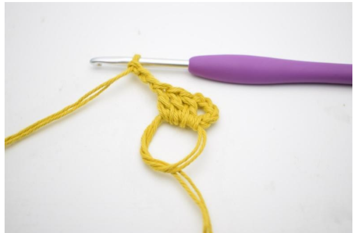
2. Crocheter "3 b et 3 ml".