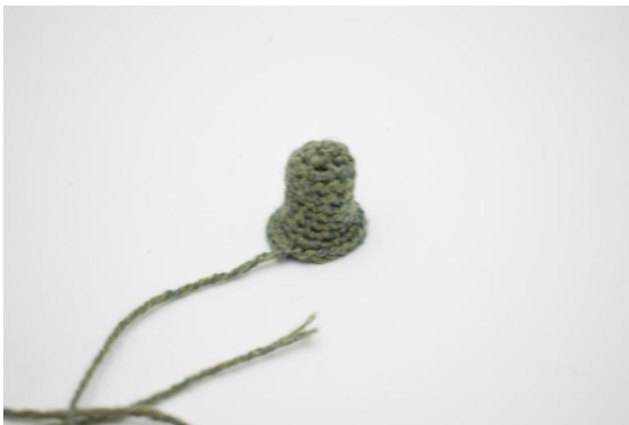
23. Coudre la tige dessus.