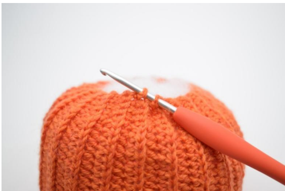
17. Répéter à présent avec des mc à travers 2 des côtes de l'extrémité tout le tour du fond de la courge.