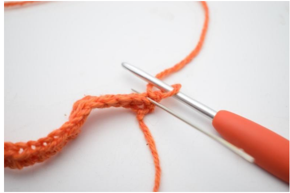
2. A partir de maintenant, ne crocheter QUE dans les ba.