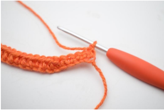
1. Retourner avec 1 ml.