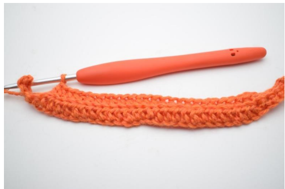
4. Crocheter 1 db dans les 20 (25) m suivantes.