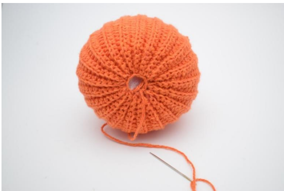
19. Couper le fil et ferme le trou.