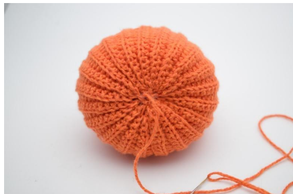
20. Comme ceci.