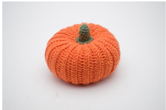
24. Comme ceci.