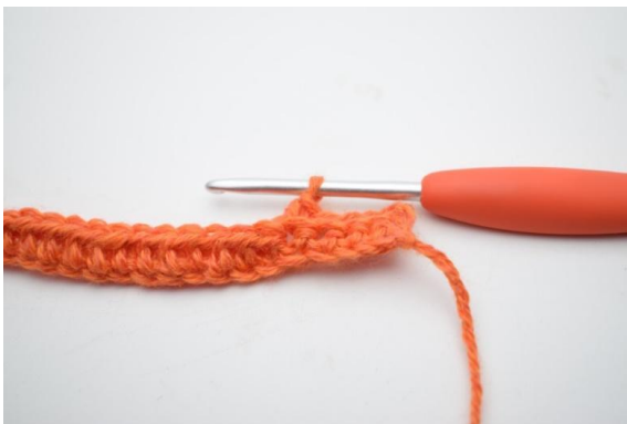
3. Crocheter 1 ms dans les 4 (5) premières m.