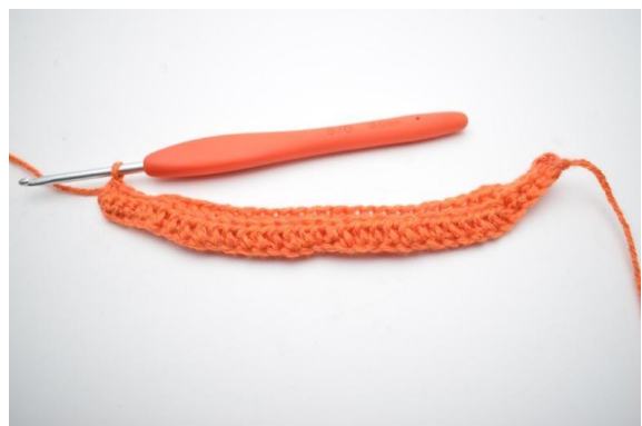
6. Comme ceci.