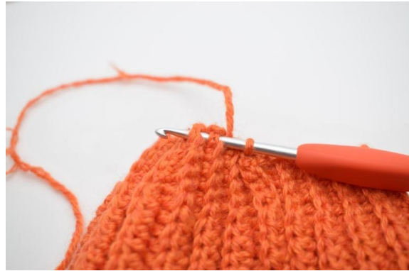
10. Crocheter des mc à travers les 2 côtes suivantes.