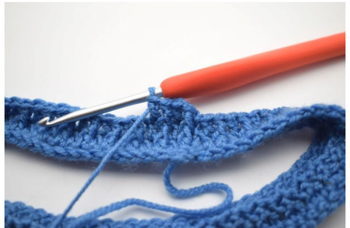
6. Crocheter "1 bRav autour de la première m. Crocheter 1 b normale dans la m suivante".