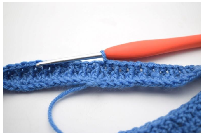
10. Crocheter "1 bRav autour de la première m. Crocheter 1 b normale dans la m suivante". Répéter de "à" tout le tour. Finir avec 1 mc dans la première bRav. (74 (78) 82 (86) 92 (96) 100)