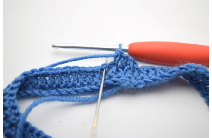
8. Crocheter 1 b dans la m d'à côté."