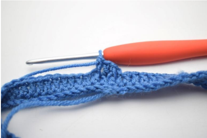
7. Comme ceci.