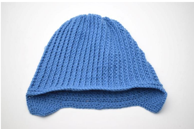
5. Couper et rentrer le fil.