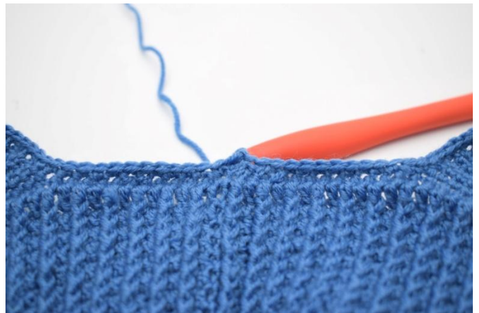
4. Finir avec 1 mc.