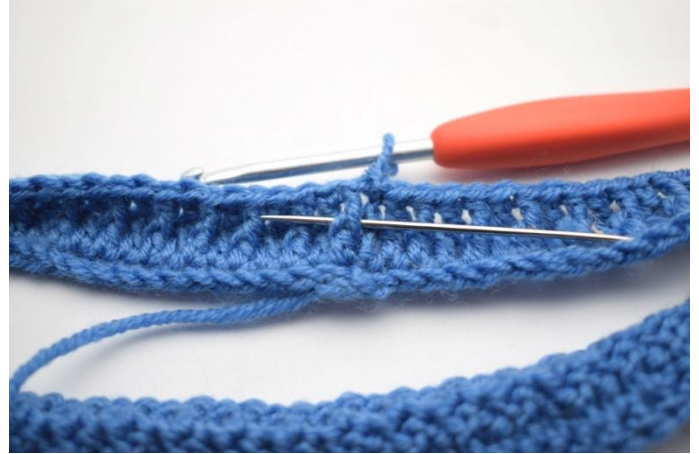
2. Crocheter 1 bRav.