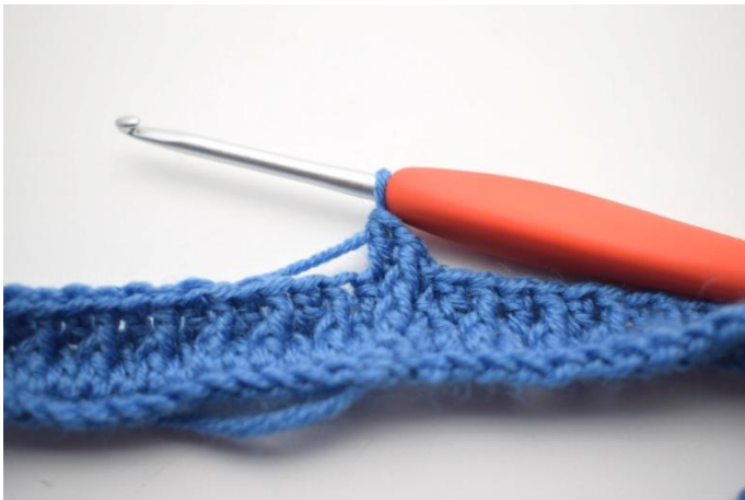
5. Comme ceci.