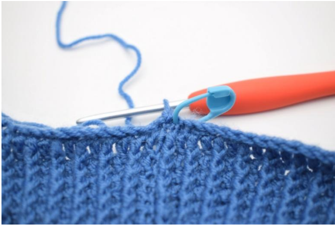
1. Insérer le fil au milieu derrière.

Insérer le fil au milieu derrière. Faire 1 ml. Crocheter des ms autour du bord et des deux oreillettes. Dans les angles au niveau des oreillettes, crocheter 2 ms. Finir avec 1 mc.