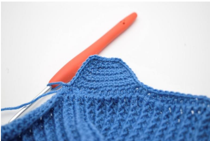
3. Dans les angles au niveau des oreillettes, crocheter 2 ms.