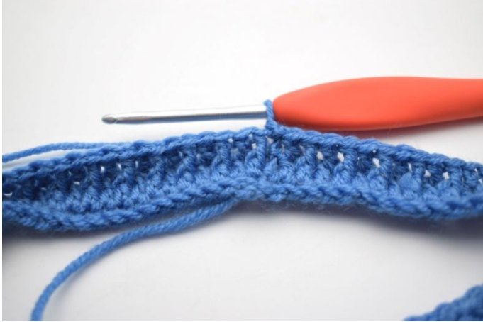
1. Se crochète comme le tour 3. Faire 1 ml.