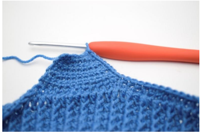
2. Crocheter des ms autour du bord et des deux oreillettes.