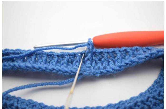
4. Crocheter 1 b dans la m d'à côté.