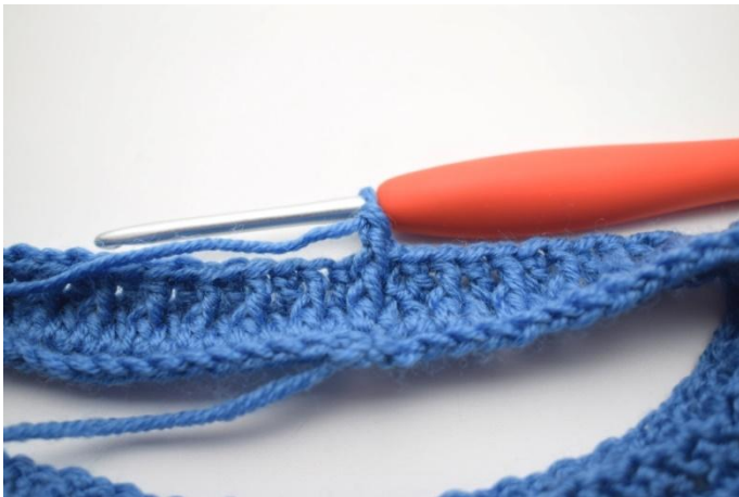
3. Comme ceci.