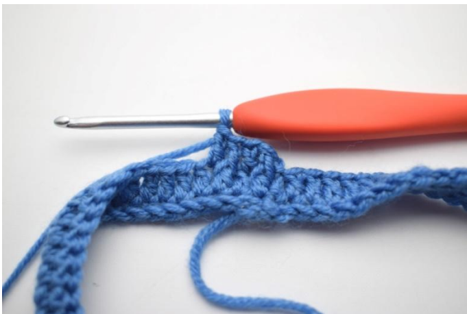
9. Comme ceci.