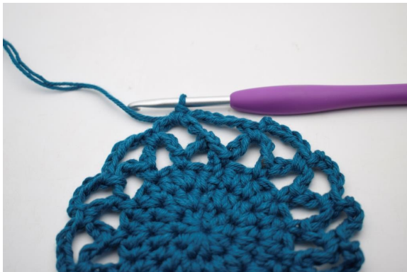
21. Ainsi. (15 espaces de ml)