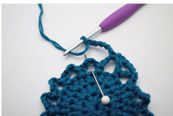
18. « Faire 5 ml et crocheter 1 ms dans le prochain espace de ml ».