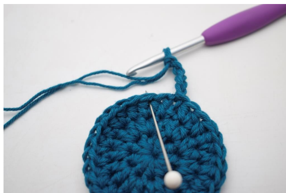
6. Sauter 1 m et crocheter 1 ms dans la m suivante ».