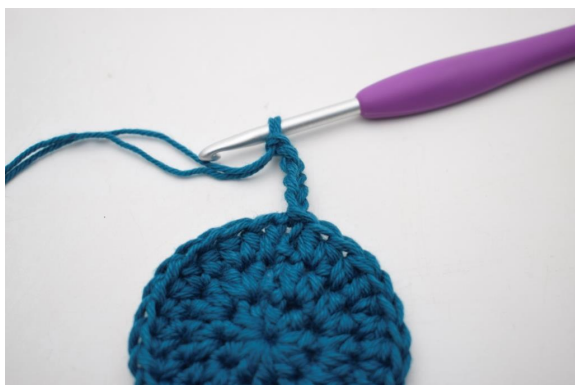
5. « Faire 5 ml.