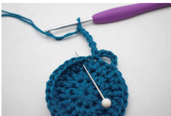
9. Sauter 1 m et crocheter 1 ms dans la m suivante ».