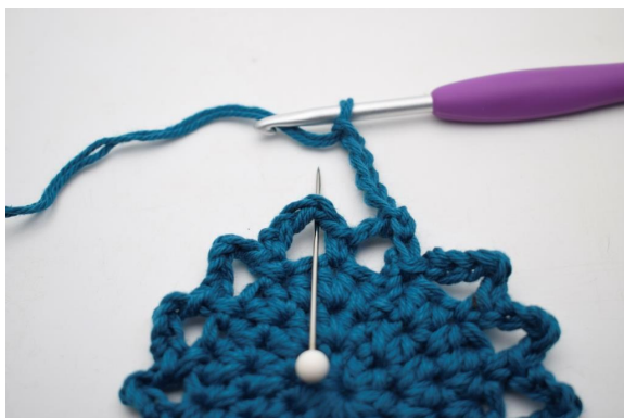
16. « Faire 5 ml et crocheter 1 ms dans le prochain espace de ml ».

ml pour ainsi commencer au milieu de celui-ci.