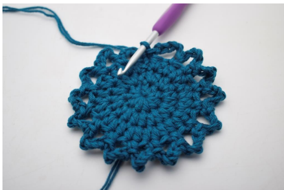
13. Ainsi. (15 espaces de ml)