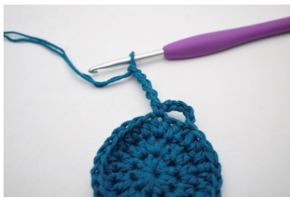
8. « Faire 5 ml.