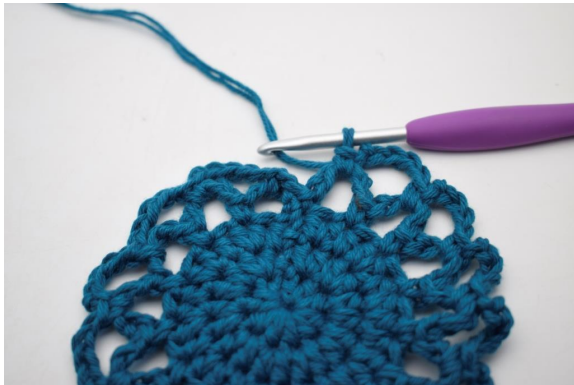
20. Répéter de « à » tout le tour.