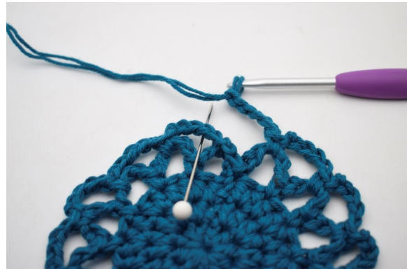
20. Le tour est terminé avec 1 ms dans le premier espace de ml, qui a été formé sur ce tour.