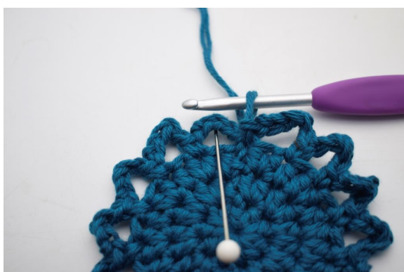
14. Faire 3 mc le long du premier espace de