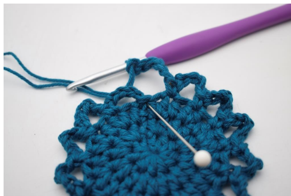
12. Terminer avec 1 mc.